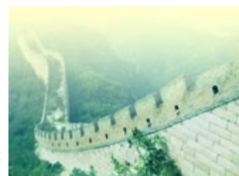
Den kinesiske mur